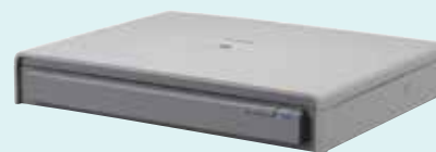
Glace d'exposition A3 Flatbed 201