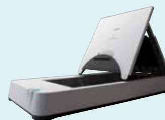
Glace d'exposition A4 Flatbed 101

Les scanners DR-C225/W ont été conçus pour faciliter la numérisation grâce à des fonctionnalités intuitives. Le mode entièrement automatique (avec le logiciel CaptureOnTouch) propose les meilleurs réglages pour les paramètres principaux des documents – soit la détection de l'orientation du texte, la détection du format de page, la couleur, la résolution et la suppression de pages blanches, ce qui permet d'économiser du temps et du travail.