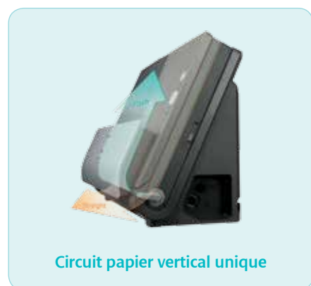
Circuit papier vertical unique

Le circuit d'alimentation papier vertical permet au scanner DR-C225/W d'afficher le plus faible encombrement de sa catégorie. De plus, la conception astucieuse du passage des câbles permet d'appuyer ces appareils directement contre un mur ou bien de les placer sur un plan de travail dont la surface est limitée.